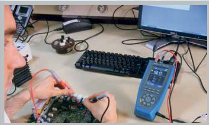
... ou en après-vente