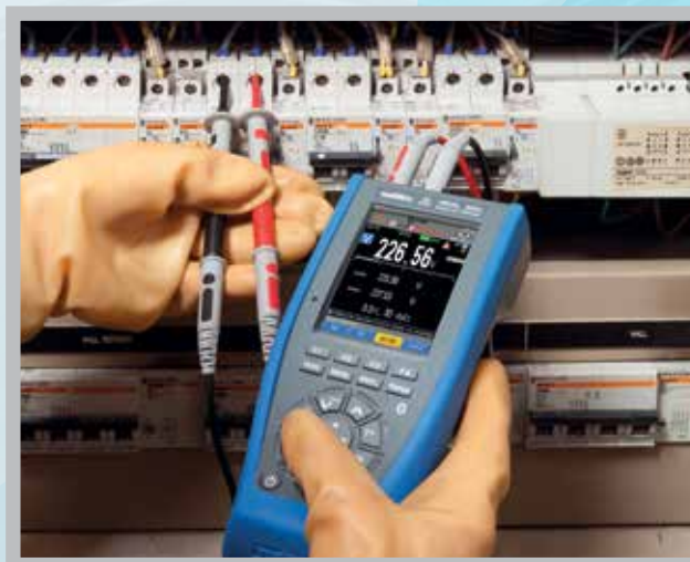
Mesures sur armoires électriques