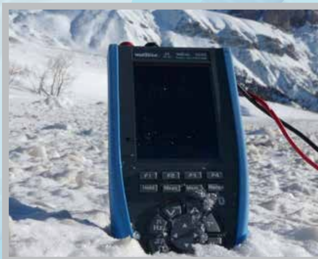
IP67, l'étanchéité des ASYC IV leur permet de couvrir des applications en environnements difficiles