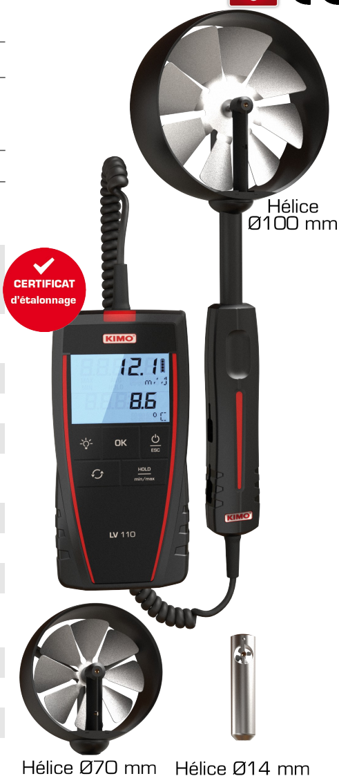
Hélice Ø100 mm Hélice Ø70 mm Hélice Ø14 mm