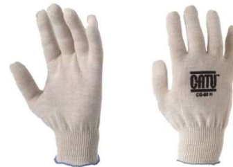
Sous-gants coton CG-80H/F