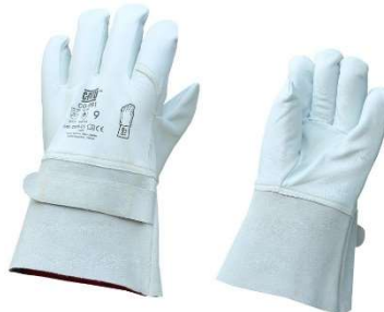
Surgants en cuir CG-991