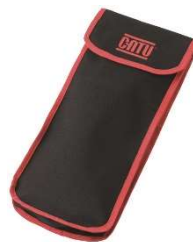
Sac de protection CG-36/1, CG36/2