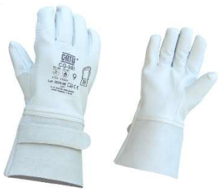
Surgants en cuir CG-981