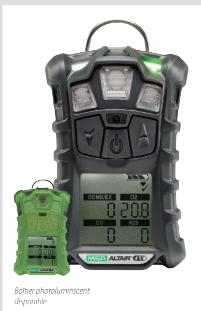
Boîtier photoluminescent disponible