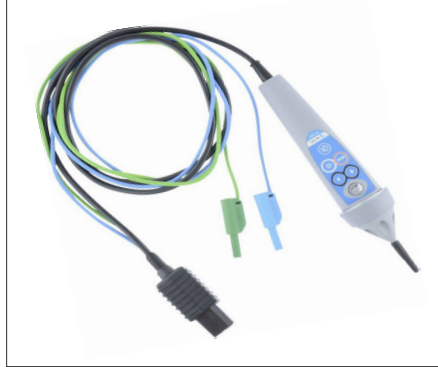
A1401 : Sonde active type pointe de touche