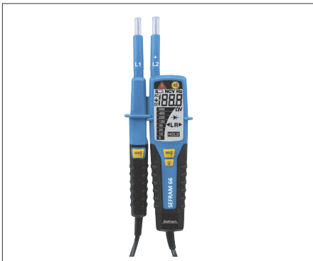
Sefram 66 : VAT / DDT jusqu'à 1000 V AC et 1500 V DC