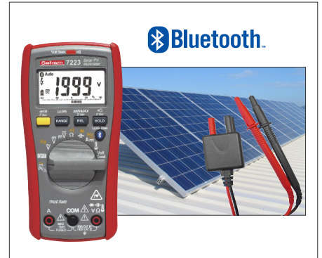
Sefram 7223 + SA163 : Complétez votre ensemble de test avec un multimètre communiquant dédié au photovoltaïque.