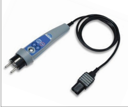
A1314 : Sonde active 2P+T