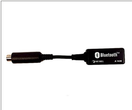
A1436 : Dongle Bluetooth pour communication entre les appareils