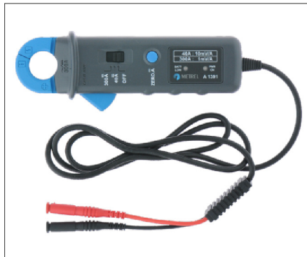
A1391 : Pince AC/DC 300A