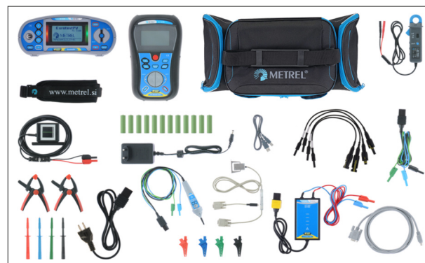
Un jeu d'accessoires complets livré en standard