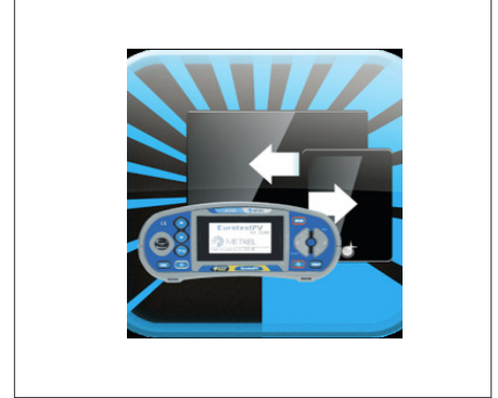
A1431 : Licence EuroLink Android®