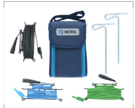
S2026 : Kit de mesure de terre avec piquets