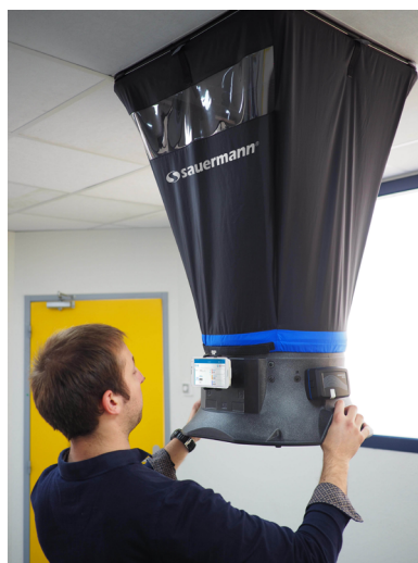
Mise en situation du débitmètre