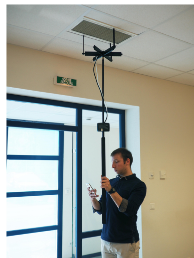
Utilisation avec la grille de mesure