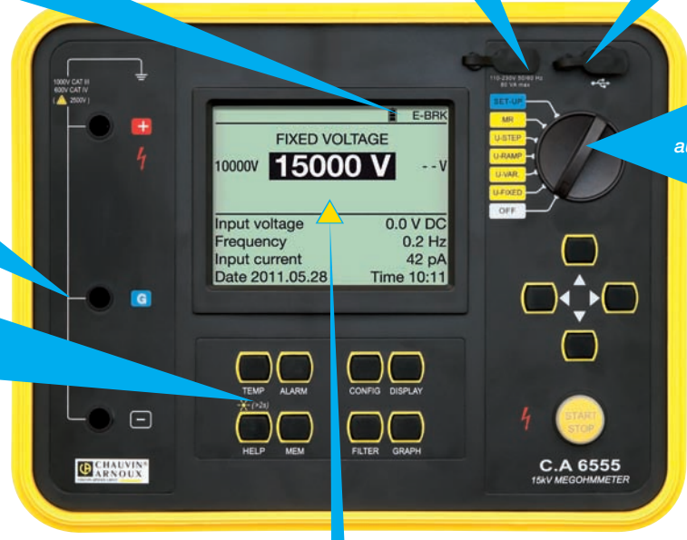
Grand écran LCD graphique rétro-éclairé

Bouton START/STOP pour déclenchement de la mesure