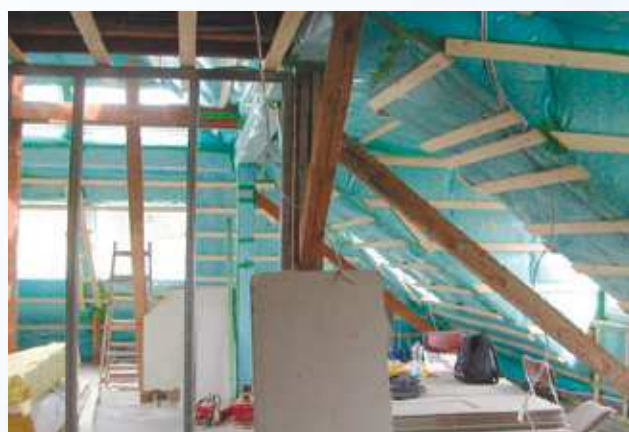
La mesure BlowerDoor pour la démarche qualité pendant la construction

Outre la possibilité d'effectuer des mesures BlowerDoor automatiques, le nouveau logiciel TECTITE Express 4.1 offre des nouvelles fonctions telles que les mesures semi-automatiques et, au besoin, les mesures manuelles. On peut également inclure les dates d'étalonnage du manomètre et du ventilateur dans le rapport de test BlowerDoor. 12 paliers de pression peuvent être sélectionnés. Si les conditions météo sont mauvaises, ou si le bâtiment présente des caractéristiques spécifiques, la précision des mesures peut être augmentée en prenant jusqu'à 1.000 points de mesure par palier de pression. Pour chaque série de mesure les températures extérieures et intérieures sont indiquées ainsi que les pressions atmosphériques correspondantes. Grâce à la conception modulaire, un système de mesure BlowerDoor existant et équipé du DG-700 existant, peut à tout moment être complété par la fonction WiFi (voir ci-dessous).