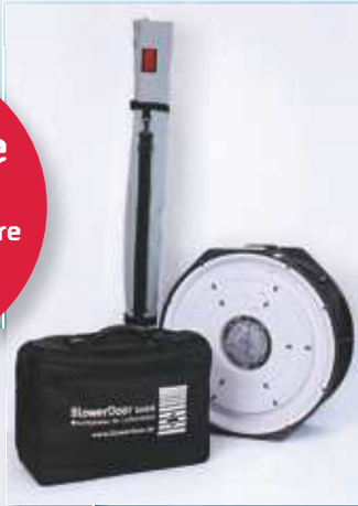
En haut : Minneapolis BlowerDoor Standard

4 ans de garantie sur tous les systèmes de mesure Minneapolis BlowerDoor !