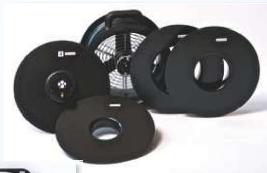
En haut : Ventilateur DuctBlaster (système de mesure BlowerDoor MiniFan) avec anneaux 1-4