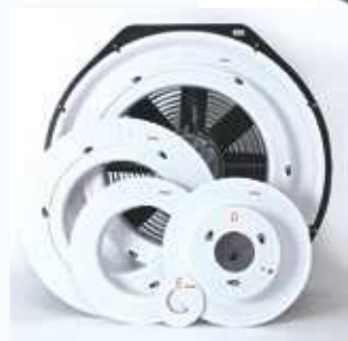
A gauche : Ventilateur BlowerDoor Standard avec anneaux A-E