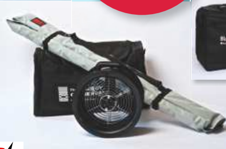
A gauche : Maniable – Minneapolis BlowerDoor MiniFan