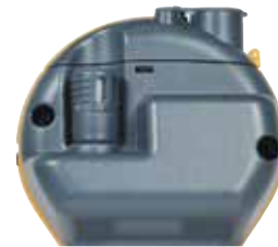
Le Quikstick ST POL78751, standard avec tous les kits MMS3 et avec les mêmes performances que le Quikstick standard. Un Quikstick ST peut rester connecté au MMS3 tout en utilisant les broches.

Les lectures de plusieurs Hygrosticks peuvent être prises et enregistrées facilement. Les lectures d'humidité peuvent être prises à l'aide de manchons d'humidité ou d'une boîte d'humidité. Des hygrosticks, et non des Humisticks, doivent être utilisés pour ce test.